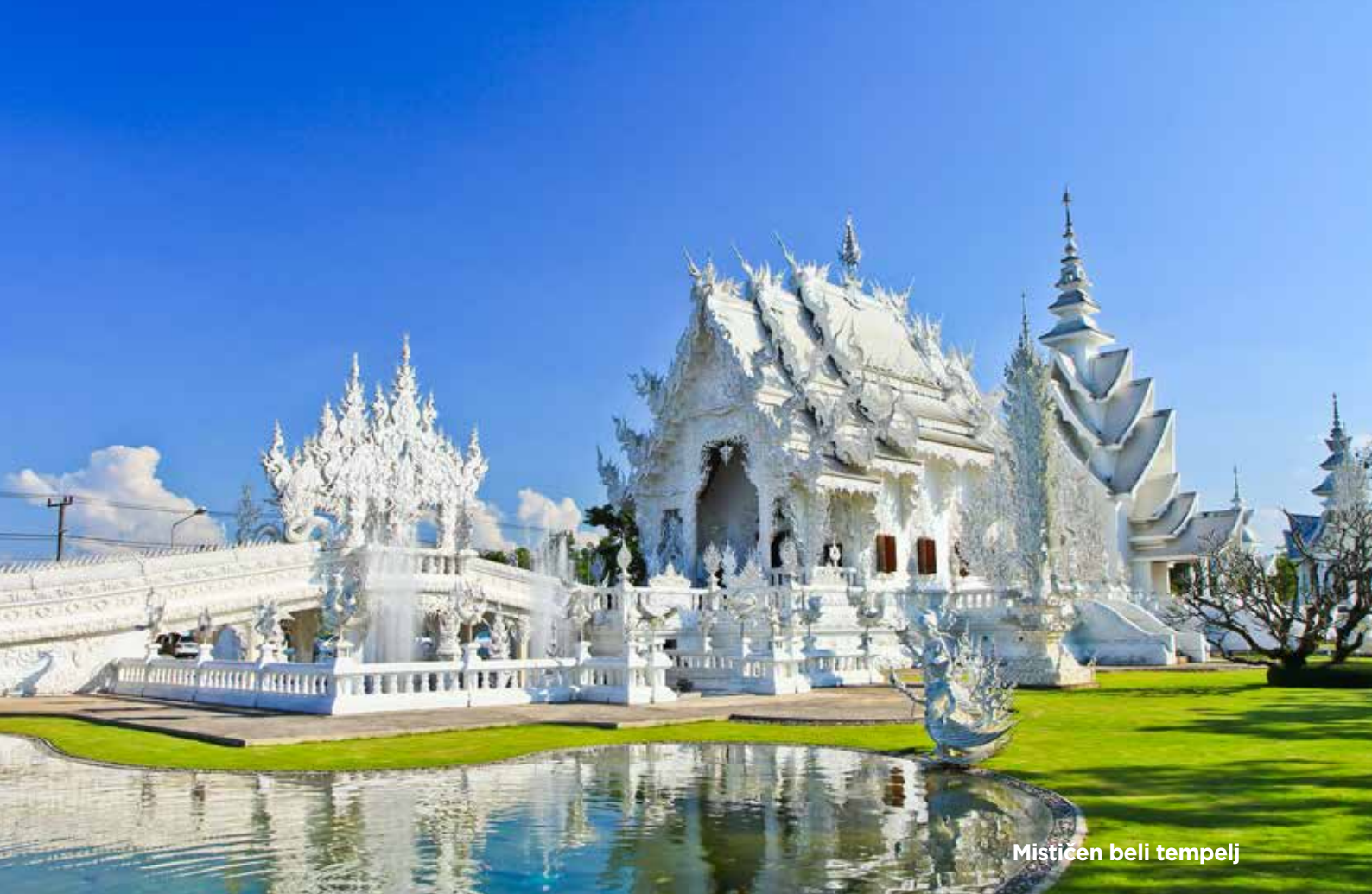
Mističen beli tempelj