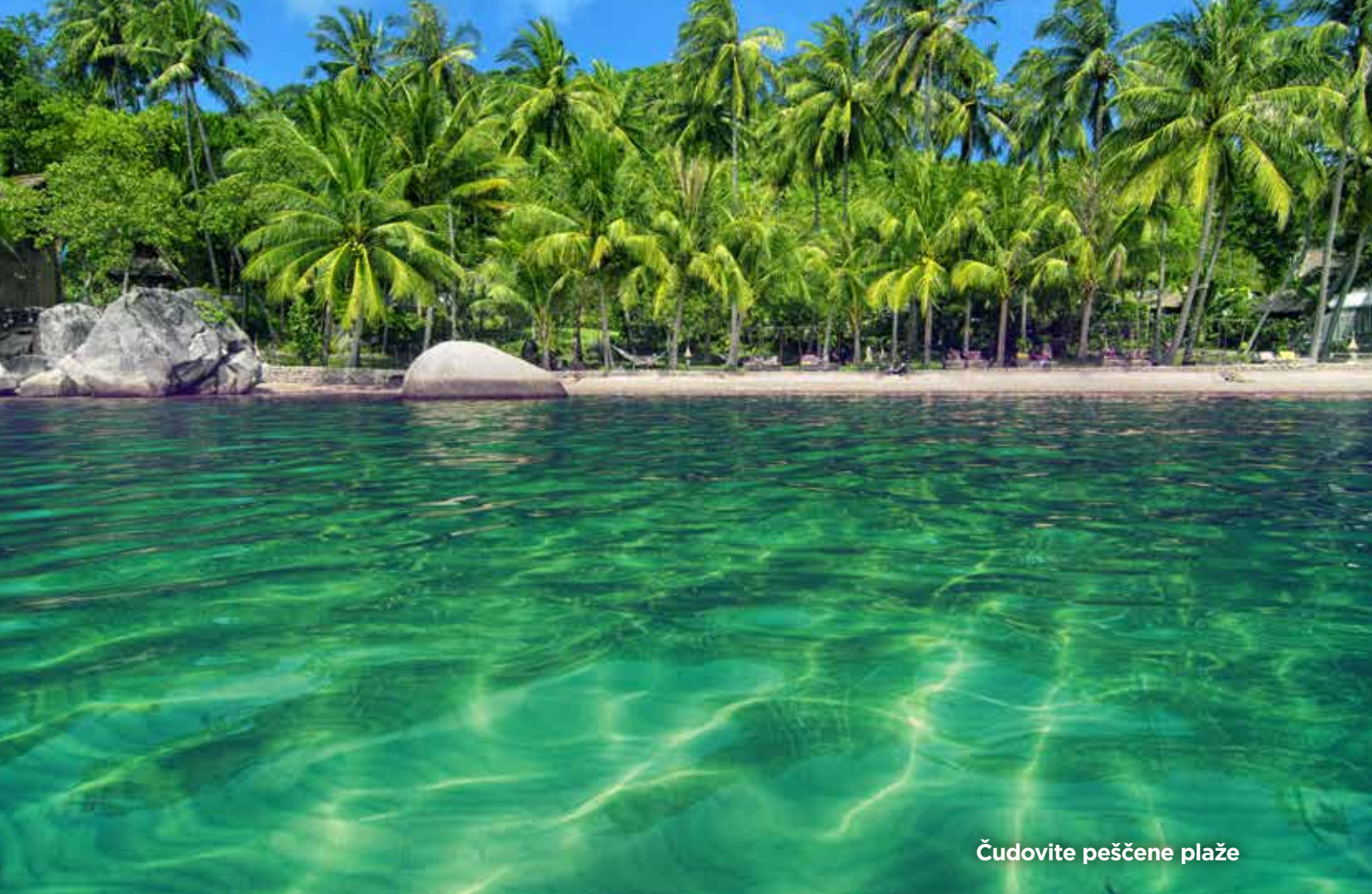
Čudovite peščene plaže