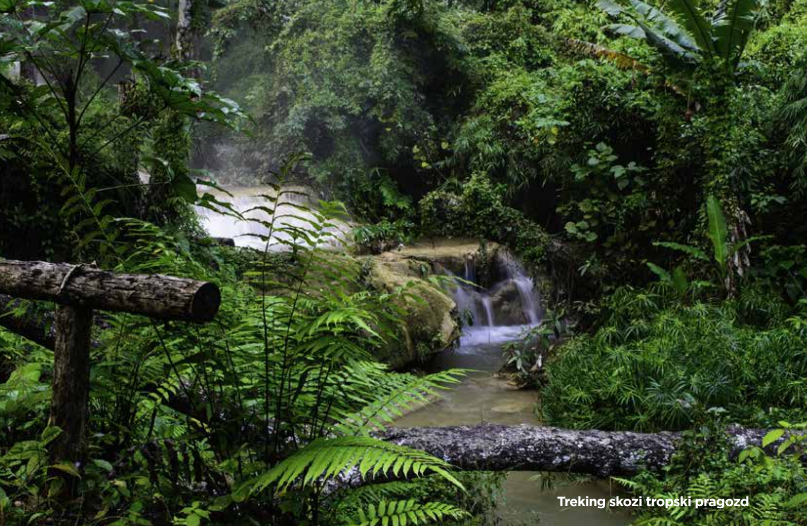
Treking skozi tropski pragozd

odročna lokacija, rastlinje, ki je preraslo zgradbe in kipe templja, ter potok s slapom dajejo templju mističen značaj. Na vrhu drugega je tempelj Doi Suthep, sveti kraj za mnoge Tajce. Dih vam bo vzel impresiven razgled na Chiang Mai in okolico. Na tretjem obiščemo vasico starodavnega gorskega plemena in botanični vrt . Večerni sprehod skozi stari del mesta Chiang Mai z možnostjo večerje in dobre zabave.